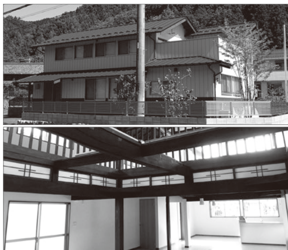
利用が始まった移住体験施設MuLife