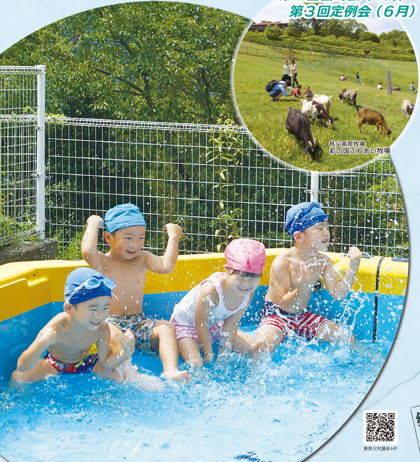
秩父高原牧場 彩の国ふれあい牧場