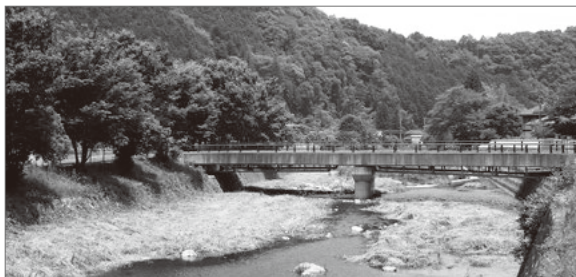
試料となる水を採取するふれあい橋付近

一級河川…河川法(1965年制定)により、国土保全上または国民経済上重要な水系(川の流れのつながり)のうち特に重要なものを一級水系とし、その中で国土交通大臣が指定・管理する河川を一級河川といいます。(大きさや水質では判断されません)