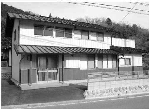
改修の済んだ移住体験住宅

[※] 議長は議事進行を行うため賛否表明はしません。賛否同数の場合のみ、「議長裁決」として表明します（「裁」と記載）。