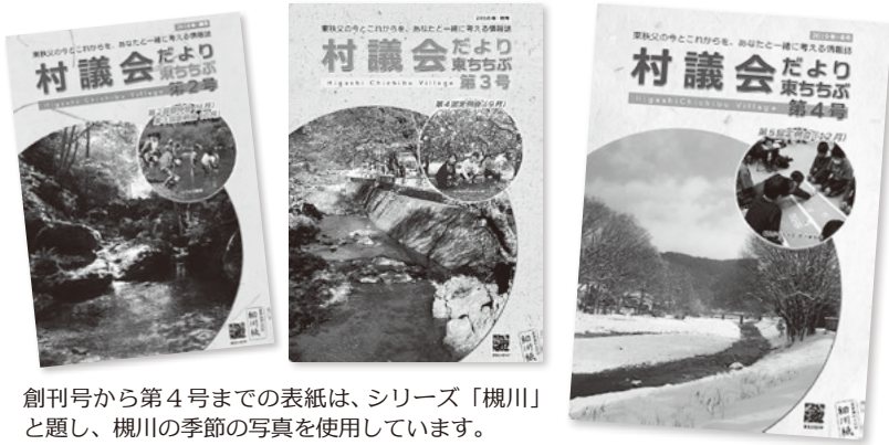
創刊号から第4号までの表紙は、シリーズ「槻川」と題し、槻川の季節の写真を使用しています。