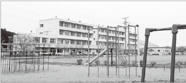
施設一体型の公立小中一貫校「城山学園」(坂戸市)