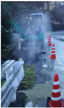
漏水復旧作業現場

答 令和5年度決算時における1立方メートル当たり155.5円の給水原価は410.1円を大きく下回っており、そのバランスは非常に悪い状態にあります。現状の施設能力としては、1日あたり1327立方メートルの水が配水でき、これは令和5年度の1日平均配水量の実績836立方メートルに対し1.587倍の余力がある状態にあると言えます。