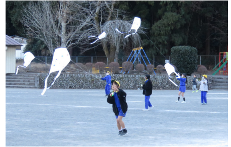
第5回 凧揚げ体験をしよう！