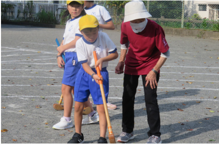
第3回 グラウンドゴルフを体験しよう！