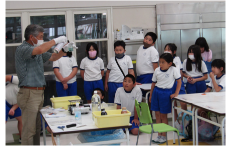
第2回 おもしろ科学実験を体験しよう！