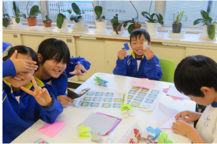
第4回 折り紙万華鏡を作ってみよう！