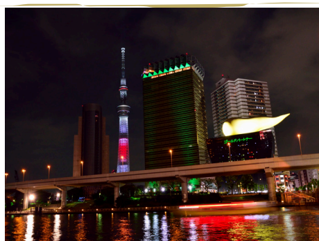
「スカイツリー夜景」

田舎にはない風景を写真に収めたいと思い、夏の夜に鮮やかにライトアップされたスカイツリーを撮影しました。動くものを写真に取り入れることで違う見方ができるため、船が通りがかったところでシャッターを切りましたが、船の速度にシャッター速度を合わせるなど細かい工夫が必要です。一瞬を切り取るのは写真にしかできません。場面や被写体に合わせて調整しながら撮影するのは楽しいです。また、良い写真に仕上がると嬉しい気持ちになるので、そういったところにやりがいを感じますね。