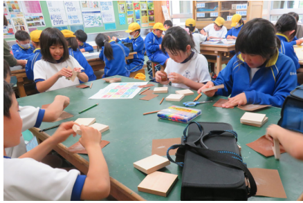
第1回 木っ端でコースターづくり体験