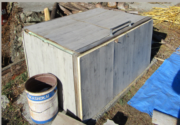
蒸した楮を保温するボックス