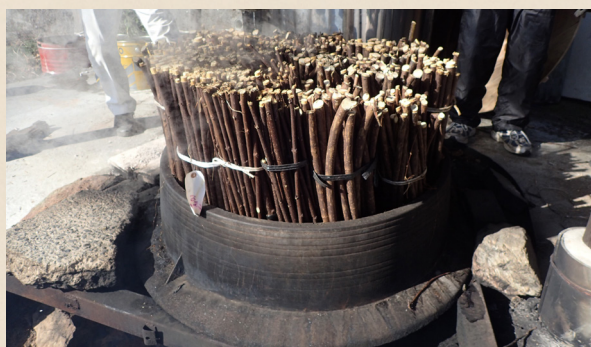
② 大釜で蒸す ※和紙の里から提供された大釜