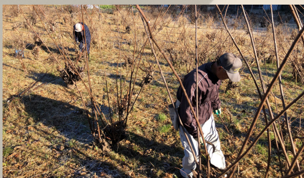
① 楮きり 楮を収穫して85cmに切り揃えます