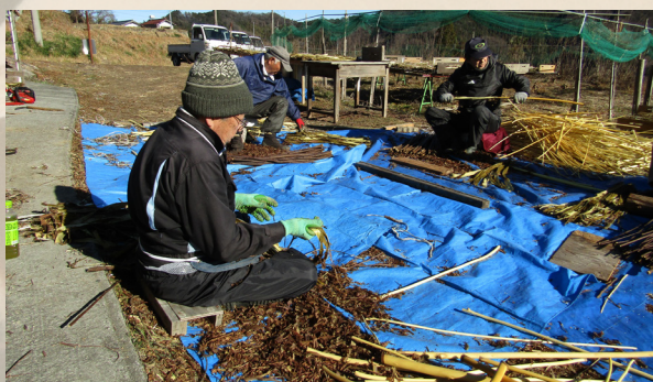
③ 皮むき 蒸した楮が冷える前にすぐ剥きます