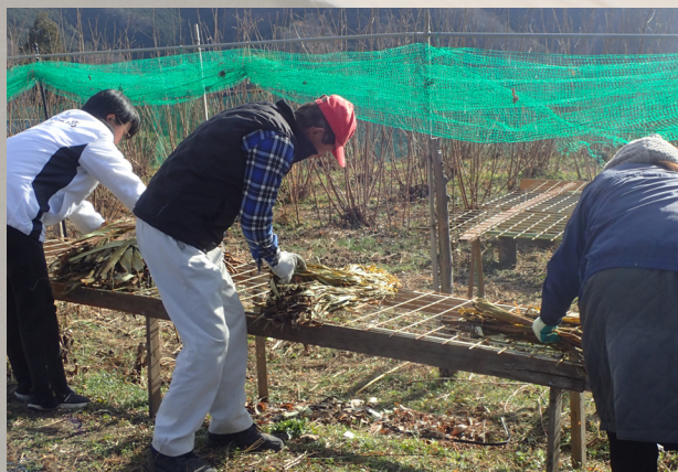
楮の皮を天日干しする台