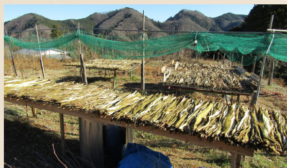
④ 天日干し 約20日間干します(10日で裏返す)