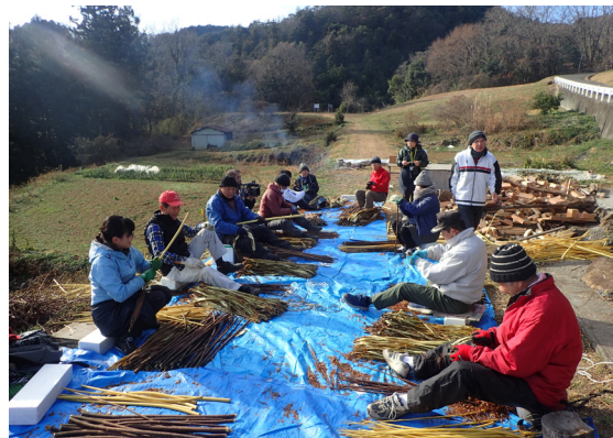
- 表紙写真 -