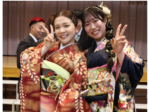
- 表紙写真 -