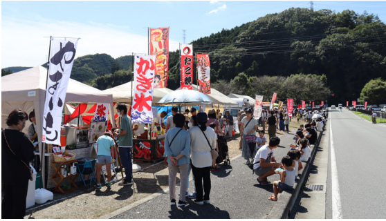
観光客でにぎわうふれあい広場

9月24日(日)、ふれあい広場で「ひがしちちぶ曼珠沙華まつり」が開催されました。曼珠沙華(まんじゅしゃげ)とは彼岸花の別名です。日本各地の代表花を紹介する人気のカレンダー「日本花紀行2023」に東秩父村の曼珠沙華が掲載されたことを踏まえて、里山の会が「村を有名に資する目的」で開催しました。