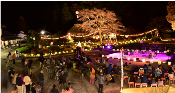
和紙フェス2019年の様子

今年はランタンナイトと村バルが4年ぶりに復活し村内在住アーティスト『世間知らず二重奏』や『AJATE』による野外ライブで和紙に灯された村の夜を盛り上げます！