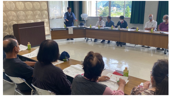
スクールガード講習会の様子

9月26日（火）、教育委員会が主催するスクールガード講習会を東秩父村役場にて開催しました。