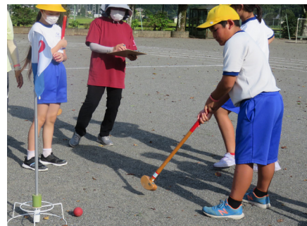
グラウンドゴルフを体験をする子どもたち

9月11日（月）、槻川小学校校庭にて第3回放課後子ども教室「グラウンドゴルフを体験しよう」を開催しました。グラウンドゴルフ協会の皆様にご協力いただき、6つのチームに分かれてコースを回りました。初めはボールを打つ強さに苦戦していましたが、次第にコツを掴んでいき、5人の子どもたちがホールインワンを取っていました。地域の方々と交流ができ、子どもたちにとって有意義な時間となったようです。