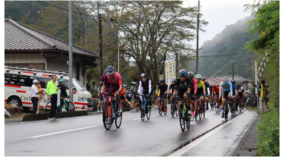
光官寺をスタートした選手たち

10月1日(日)、定峰峠チャレンジ実行委員会が主催した自転車ロードレース「定峰峠ヒルクライム2023」が開催されました。コースは皆谷の光官寺前をスタートし、ときがわ町の堂平天文台がゴールの全長12.8キロ、山間部ならではの上り坂が多く、最大勾配は13.8度です。参加した210人の選手たちが一生懸命ペダルを漕ぐ姿に、沿道からは大きな声援が送られました。