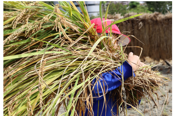
- 表紙写真 -