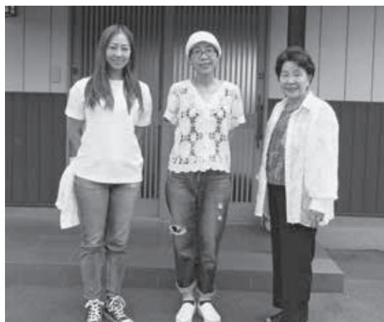
さいたま市よりお越しの100組目の皆さん

令和元年6月より運用を開始した移住体験施設「MuLife（ムライフ）」は、築80年を超える古民家をリフォームし、村への移住を希望する方が実際の生活を体験するための施設です。5年目を迎えるにあたり、利用者が100組を超えました。これも村民の皆さまが温かく迎え入れてくれたおかげです。今後も引き続き村のPRの場として、移住希望者の受け入れを行っていきます。