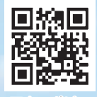
天空のポピー ホームページ

新型コロナウイルス感染拡大の影響により開催を見送りしていたポピーまつりを4年ぶりに開催します。