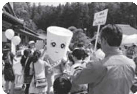
▲わしのちゃんは人気者