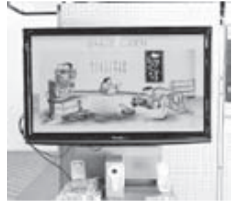
□ビーで放映中です

・和紙の里では、和紙すきの歴史や施設案内などを紹介する上映コーナーを設置しました。今後も皆さまが楽しめるよう、新しい映像を作成中です。ぜひご覧ください。