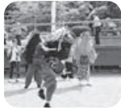
▲新緑の中、舞い、奏で、練り、つくられたステージ

第12回ふるさと響きまつりでは、纏(まとい)煉り行列、獅子舞、コーラス、太鼓演奏、フラダンスなどがステージを飾り、創作美術展や和紙すき実演と体験、村内ふるさと市、手作りマーケット、お茶席、折り紙教室などのイベントに訪れた方々は、それぞれの思いで楽しい時を過ごされたようです。また、東秩父村のマスコットキャラクターの「わしのちゃん」が会場に現れると、写真撮影に握手・ハイタッチと、子どもから大人まで大人気となりました。