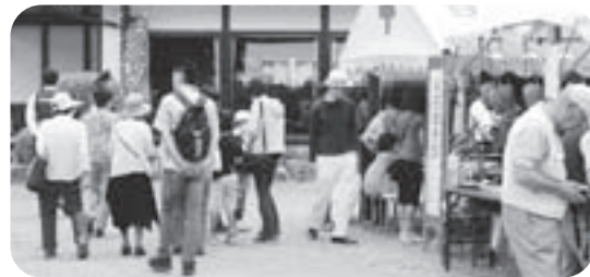
▲多くの方々が訪れました