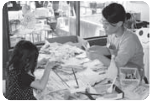
▲和紙をつかったうちわ作り