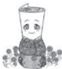
わしのちゃんとクジャク花