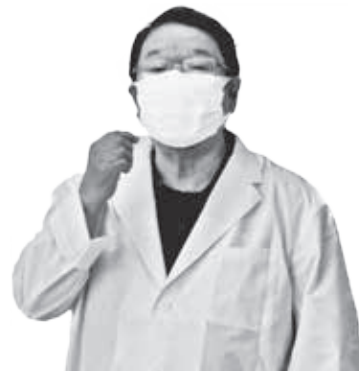
高野実先生による歯科講話の様子