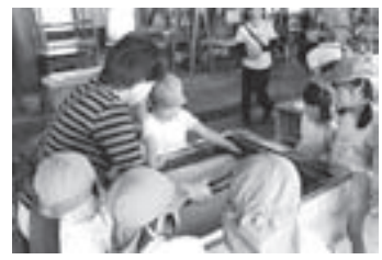
和紙漉き体験はどなたでもできます！（子どもたちだって、ほら漉けた！）

和紙の里では紙漉き体験を随時募集しています。花を使ったタペストリーなどメニューも豊富になっていますので、伝統工芸の和紙を楽しく漉いてみませんか？ また、お食事処『すきふね』は、打ちだての美味しいお蕎麦が食べられると評判です。東秩父を満喫したいなら、ぜひ和紙の里にお越しください。