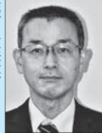
住所：東秩父村 趣味：川遊び(カヌー・魚釣り etc.)・家庭菜園 抱負：この村に越してきて早 25年。家族共々、今の私 があるのはこの村のおかげ です。少しでも恩返し ができるよう、村の宝で ある子どもたちのために がんばります。