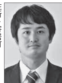
住所：寄居町 趣味：旅行・スポーツ観戦 抱負：千葉県柏市立中学校から 異動してきました。東秩 父中学校で元気な生徒た ちとともに学ぶことを楽 しみながら、生活が送れ ることを期待していま す。宜しくお願ひいたし ます。