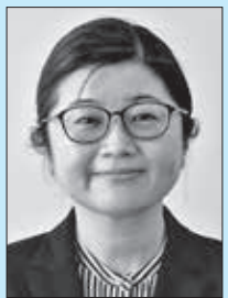
住所：滑川町 趣味：旅行 抱負：東秩父中学校で勤務させていただくのは3度目となります。初心を忘れず、一生懸命がんばります。よろしくお願いたします。