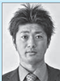
住所：東松山市 趣味：野球・DIY 抱負：7年前にもお世話になり ました。再び東秩父で仕 事が出来ることを嬉しく 思います。村の宝である 子どもたちのために全力 を尽くしていきます。