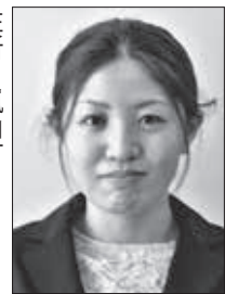
住所：嵐山町 趣味：ドライブ・バレーボール 抱負：生まれ育った東秩父村でまた働くことができ、大変嬉しく思います。生徒たちが心も身体も健康でいられるよう、微力ながらお手伝いできたらと思っています。