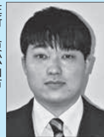
住所：東松山市 趣味：野球・音楽鑑賞・カラオケ 抱負：教員生活1年目で緊張や 失敗を重ねてしまいかも しませんが、自分の経 験や子どもたちの学習を 伸ばすために頑張らせて いただきます。未熟者で すがご指導よろしくお願 ひします。

ます。子どもたちと一緒に 元気に、精一杯頑張ら ます。よろしくお願ひい たします。