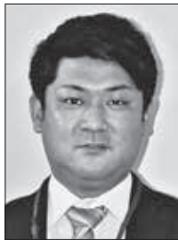
住所：小川町 趣味：旅行・ドライブ・サッ カー 抱負：小川町立小川小学校から 異動してきました。自然 豊かな東秩父村で働ける ことをとても嬉しく思い

ます。子どもたちと一緒に 元気に、精一杯頑張ら ます。よろしくお願ひい たします。