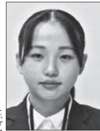
住所：秩父市 趣味：映画鑑賞 抱負：埼玉県で唯一の村である東秩父村でお仕事を出来ることを大変嬉しく思います。一生懸命頑張っております。よろしくお願いたします。