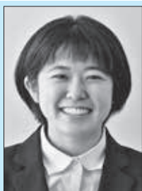
住所：小川町 趣味：音楽鑑賞・スキー 抱負：初めて勤務させていただ く学校が東秩父中学校で とても嬉しいです。生徒 たちのために笑顔で元気 に頑張ります。よろしく お願ひいたします。