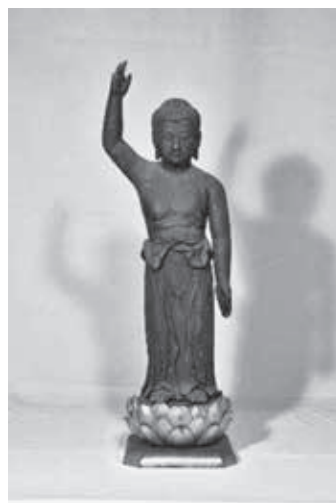
木造釈迦誕生仏立像▶