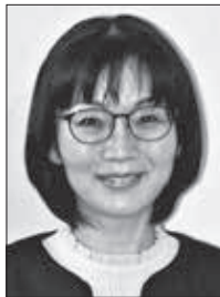
住所：寄居町 趣味：ミュージカル鑑賞 抱負：東秩父村3校目の勤務と なり、深いご縁を感じま す。このご縁に感謝しな がら、村の子どもたち の笑顔と健康を守るサ ポートをしていきたい と思います。