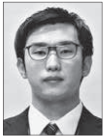
住所：加須市 趣味：旅行、ドライブ、魚釣り 抱負：自然豊かな東秩父村で働けることを嬉しく思っております。村民の皆さまのお役に立てるよう、一杯職務に取り組み所存です。よろしくお願いたします。