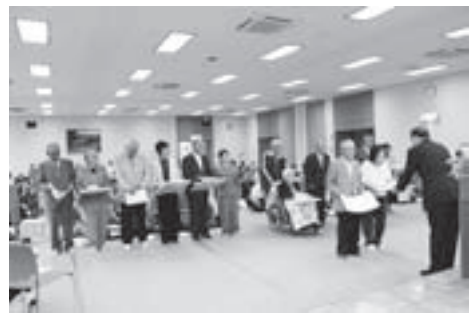
▲結婚50年を迎えられた皆さん