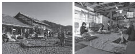
年明けに行われた「楮かしき」の様子