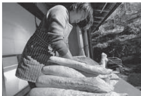
たくあん漬けにチャレンジ