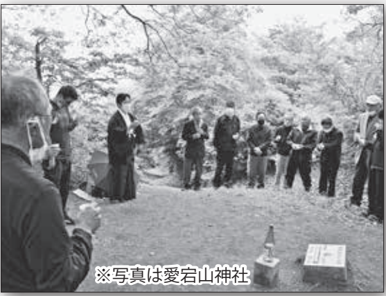
※写真は愛宕山神社