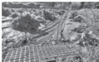
のぐんぼうの種まき(奥沢圃場)