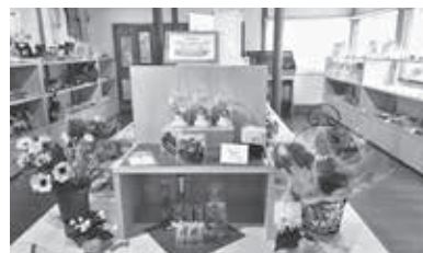
華やかで賑わった「母の日」コーナー

ゴールデンウィーク中、和紙の里売店では華やかな和紙のお花で「母の日」コーナーを設置し大変好評でした。この経験を生かし来月の「父の日」も企画したいと思います。お父さんに贈りたいものについてアイデアがありましたらぜひお聞かせください。