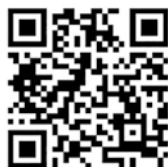
▲ YouTube アカウント 東秩父村地域おこし協力隊

2月下旬にはポピーの種まきに参加させていただきました。去年は新型コロナウイルスの影響で中止になってしまったので、今年は開催できるようにと心から願いを込めて種をまきました。