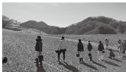
▲ポピーの種まきの様子