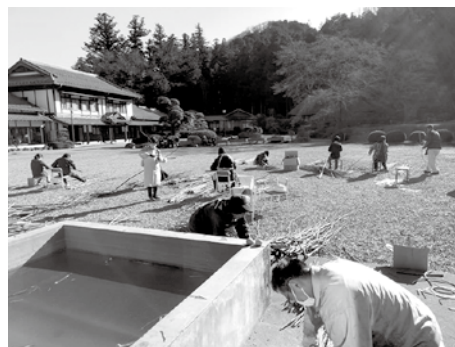
和紙の里庭園で丁寧に枝払い

は縄の結び方を覚えましたが、結び方には決まりがあり、力仕事なので苦戦しましたが、村の方のご指導と優しさでなんとか最後まで行うことが出来ました。また、新年が始まったばかりだということに作業が終わると「来年もよろしく」とご挨拶することは印象的でした。