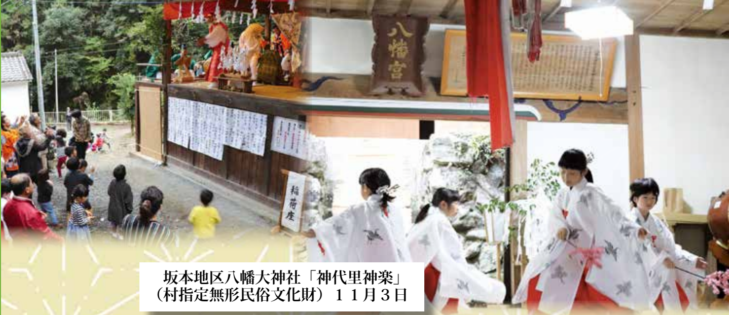
坂本地区八幡大神社「神代里神楽」 (村指定無形民俗文化財) 11月3日

11月 東秩父は 「秋祭り」日和 各地で その地に根付いた 伝統文化を 体感できる貴重なとき