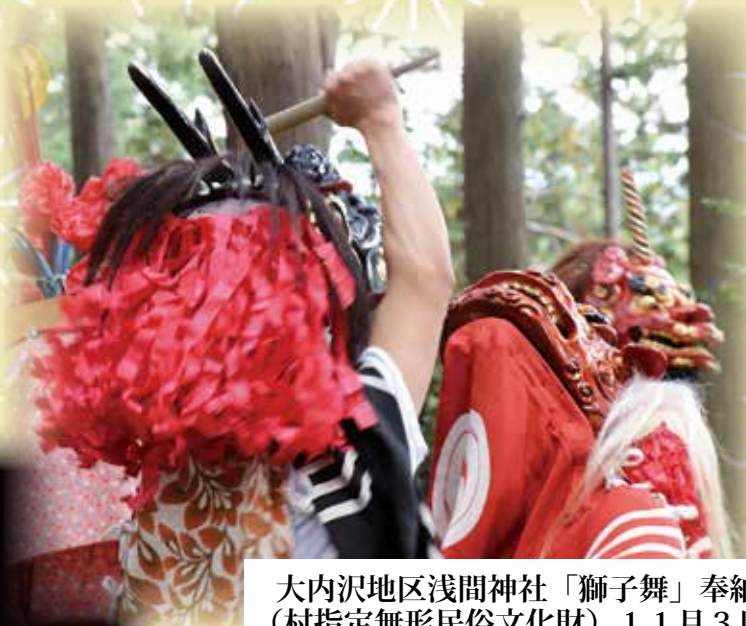
大内沢地区浅間神社「獅子舞」奉納 (村指定無形民俗文化財) 11月3日

11月 東秩父は 「秋祭り」日和 各地で その地に根付いた 伝統文化を 体感できる貴重なとき