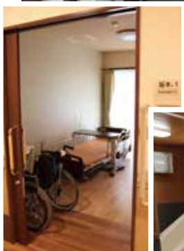
▲地名の入った居室