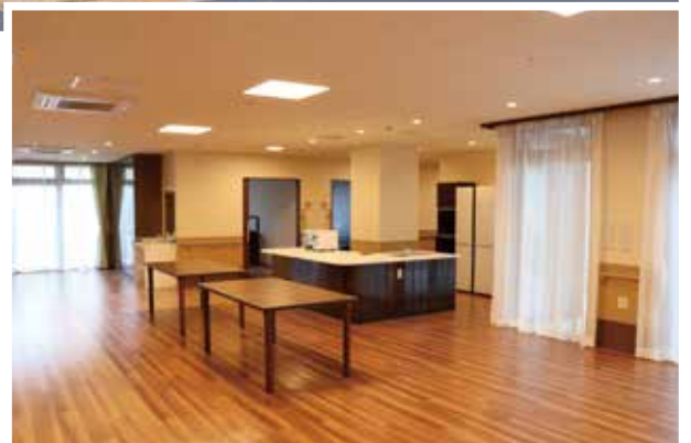
▲外観および共同スペースは広く、木のぬくもりを感じる