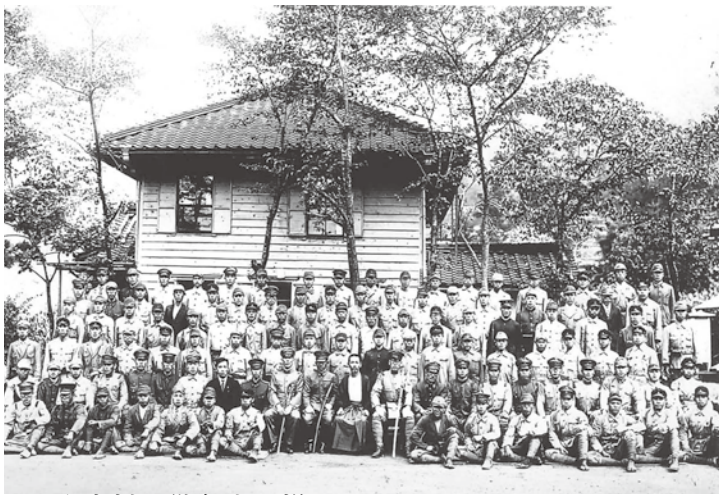
▲本村の戦争中の様子