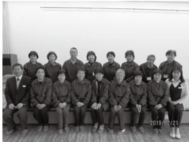
2月21日開催定例会参加の「東秩父お守り隊」の方々です。

平成28年度と平成29年度に、地域包括支援センターのボランティア養成講座を受講し、登録していただいた方々を中心に平成29年度から活動しています。この2年間は主に2人1組で東西に分かれ、週2回の配食サービスの配達を担っていただきました。配食を届けながら声掛けをし、ご利用者の体調も包括支援センターへつなげる等、地域へ出向いて活動していただきました。「東秩父お守り隊」による配達はこの3月で終了いたしましたことを感謝申し上げますとともにご報告いたします。