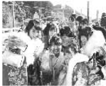
▲平成の象徴、スマホで自撮り