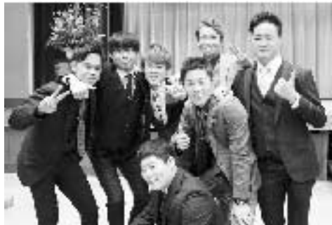
▲再結成！元気野球部の皆さん