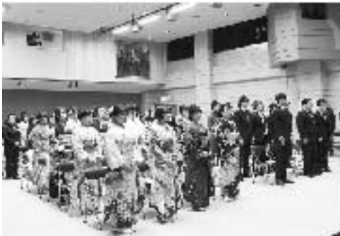
▲式典の様子、皆さん緊張の面持ち

1月13日(日)、コミュニティセンター「やまなみ」において平成31年成人式が挙行されました。当日は、穏やかな天候に恵まれ、まるで天も新成人の皆さんを祝福するような陽気で、そよ風にかすかにびくびく艶やかな着物がとてもきれいに輝いていました。皆さん、それぞれ個性豊かな晴れ姿を披露し、さまざまな思いで成人式に臨まれたようです。