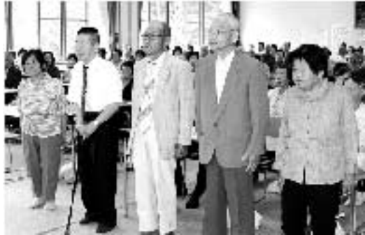
米寿を迎えられた方(敬称略)