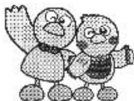
埼玉県のマスコット 「コバトン」&「さいたまっち」

※10月10日は、ミニ運動会です。保育園に上がる前に運動会が体験できる貴重な機会です。