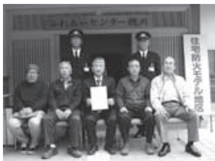
の方々には、事業への積極的な取り組みに対して感謝状が贈られました。