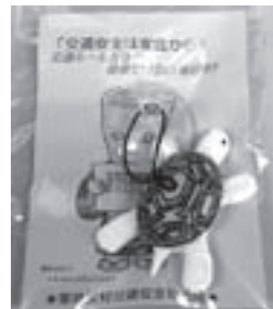
母の会で作成した交通安全マスコット