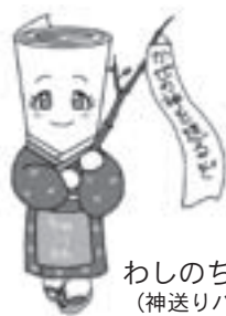
わしのちゃん (神送りバージョン)