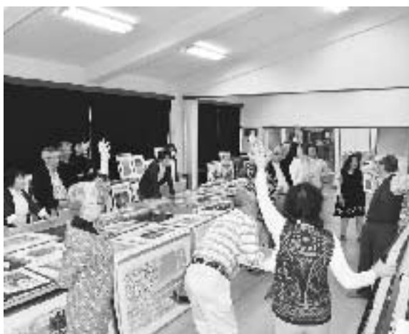
▲5月13日(日)の審査の様子