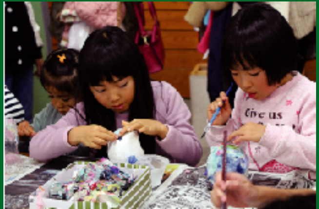
▲和紙でだるま作り。みんなが夢中になっていました。

細川紙のユネスコ無形文化遺産登録日で、「東秩父村手漉き和紙の日」となった11月27日を記念して、11月25日（土）～12月10日（日）の期間、「和紙フェス2017in東秩父村」が開催されました。写真はワークショップの様子です。小さいころから和紙にふられる良い機会でした。