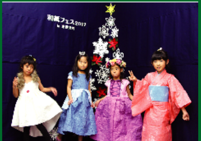
▲和紙ドレスに身を包み、お姫さま気分でハイポーズ★

細川紙のユネスコ無形文化遺産登録日で、「東秩父村手漉き和紙の日」となった11月27日を記念して、11月25日（土）～12月10日（日）の期間、「和紙フェス2017in東秩父村」が開催されました。写真はワークショップの様子です。小さいころから和紙にふられる良い機会でした。