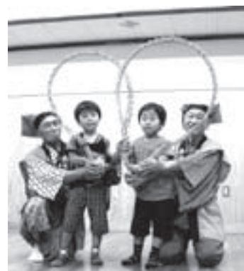
▲古の遊び『南京玉すだれ』