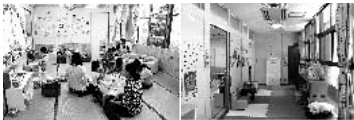
▲子育て支援センターの様子

城山保育園内に設置していた「子育て支援センター」が4月1日をもって保健センター内旧診療所へ移転となりました。保育園内では限られたスペースでのサービスでしたが、旧診療所移転後は広いスペースが確保され、お子さんがより一層のびのびと過ごせるようになりました。