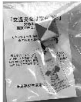
▲母の会で作成した交通安全マスコット