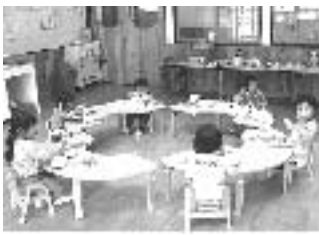
1, 2歳児 給食様子

給食担当者は、厚生労働省策定の「日本人の食事摂取基準」と子どもたちの体位を基に栄養価を算出して、行事や季節感を考慮し味は薄味に心がけて献立を作成し、衛生管理にも十分に注意して提供しています。