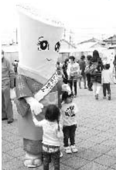
▲4/23吉見うまいもんフェア2016

春はイベント盛りだくさんでした！ 4月～5月は比企地区や寄居町など各地で東秩父村の観光案内をしてきました。