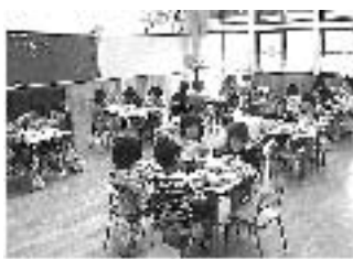
3, 4, 5歳児給食様子