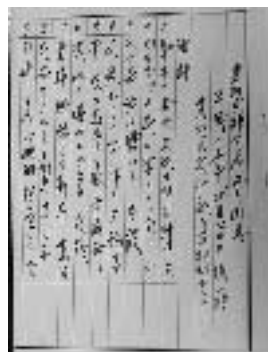
▲多くの句を生み出し、文芸欄を飾っていただきました。