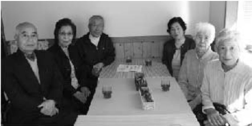
▲東秩父俳句会の皆さん

東秩父俳句会は昭和31年に発足、昭和55年より広報東ちちぶの文芸欄に掲載を開始し、約35年という長い間お世話になりました。