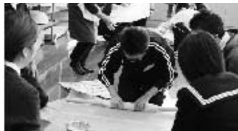
2時間目：家庭科(そば打ち)