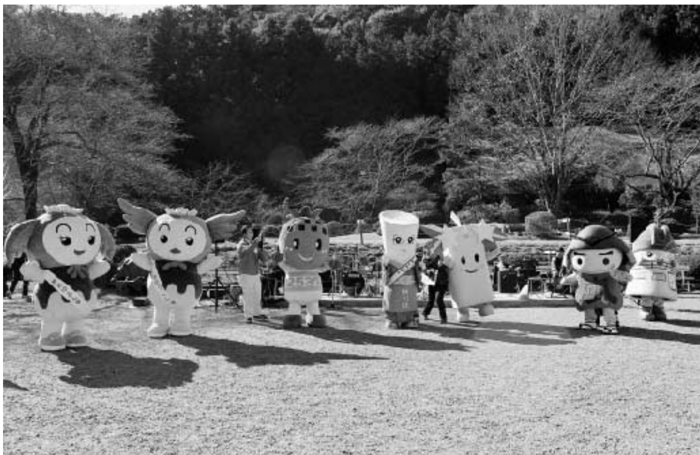
(Happy Anniversary「細川紙」ユネスコ無形文化遺産登録1周年記念イベントの様子 関連記事P8)