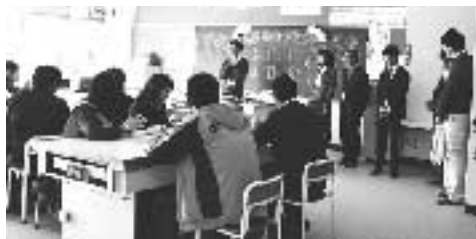
1時間目：入学式・HRには槻川小学校の家庭科室を使わせていただきました。