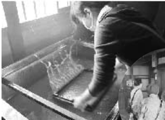
▲紙すき家屋では本格的な和紙すきの実演が行われ、見物客は興味津々の様子でした。

平成26年11月に「細川紙」が「和紙：日本の手漉和紙技術」の1つとしてユネスコ無形文化遺産に登録されたことを受け、11月28日（土）、和紙の里において登録1周年記念イベントが開催されました。当日は多くの人でにぎわい、また、比企のマスコットキャラクターもお祝いにつけてくれました。その模様をお伝えします。