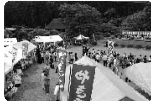
▲多くの人々が訪れました