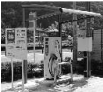
▲和紙の里前・急速充電器