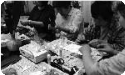
▲和紙フラワーづくり