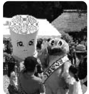
▲わしのちゃんとカワシロウくん

第14回ふるさと響きまつりでは、今回初となる槻川小学校児童たちによる合唱が催され、素晴らしいハーモニーが聞く人の心に響きわたりました。また、まとい煉り行列、獅子舞、和太鼓演奏、コーラスなど、さまざまな演目がステージを彩り、新緑と相まって初夏の和紙の里の風景を映し出してくれました。 折り紙教室やタペストリー作り、紙すき実演・体験などは子どもからお年寄りまで楽しむことができ、熱心に体験を行っている様子があがえましました。今年のフェスティバルも皆さんそれぞれが楽しい時を過ごされたようです。 そして、東秩父村マスコットキャラクター「わしのちゃん」や川の博物館マスコットキャラクター「カワシロウ」くんが会場に現れると、よりいっそう華やかな雰囲気に変わり、ハイタッチや記念撮影と人気者でした。