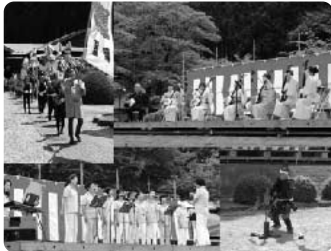
▲様々な団体がステージを彩りました