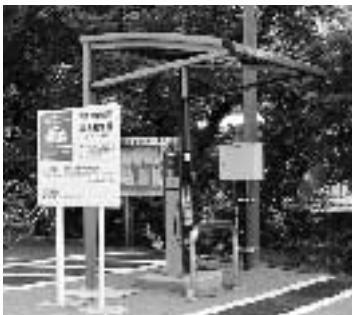
▲役場前・普通充電器

自動車4社(トヨタ・日産・ホンダ・三菱)が共同で経営する「合同会社日本充電サービス(NCS)」に加盟し、充電インフラネットワークを活用します。