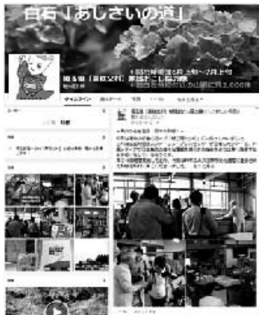
「6月時点でのページイメージ」

※フェイスブックとは、インターネット上で交流ができる世界最大規模のサービスのことで、だれでも気軽に個人・団体間で交流することができ、世界中で約13億人以上が利用しています。