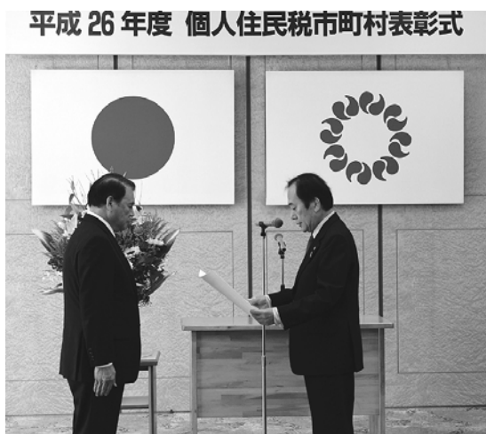
平成 26 年度 個人住民税市町村表彰式