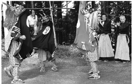
◆大内沢地区では、浅間神社に獅子舞が奉納され、木漏れ日の中舞う姿がとても印象的でした。（村指定無形民俗文化財）【11月2日】