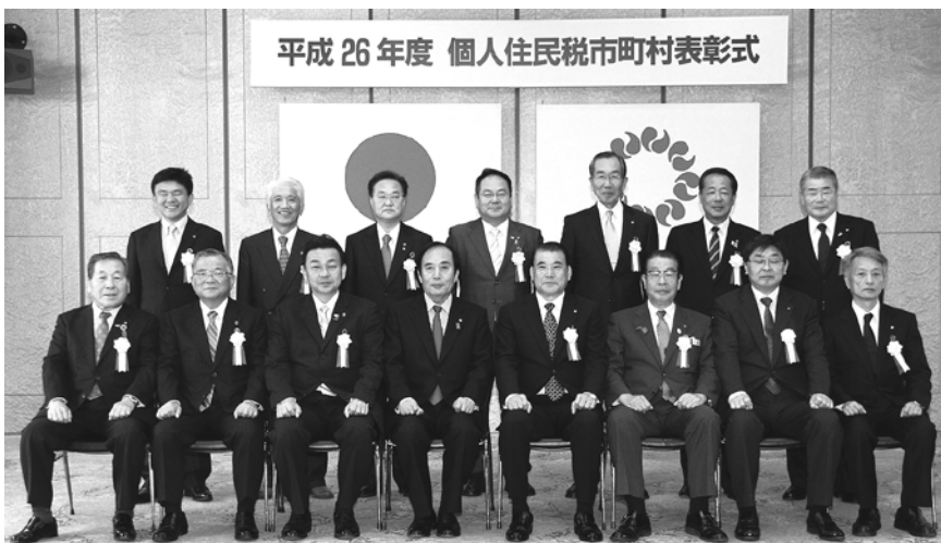
平成 26 年度 個人住民税市町村表彰式

こうした実績を残すことができたのも、住民の皆さまの納税に対する深いご理解があったことから、深く感謝申し上げます。今後も適正な賦課に基づく徴収を行ってまいりますので、皆さまのご理解ご協力をよろしくお願いいたします。