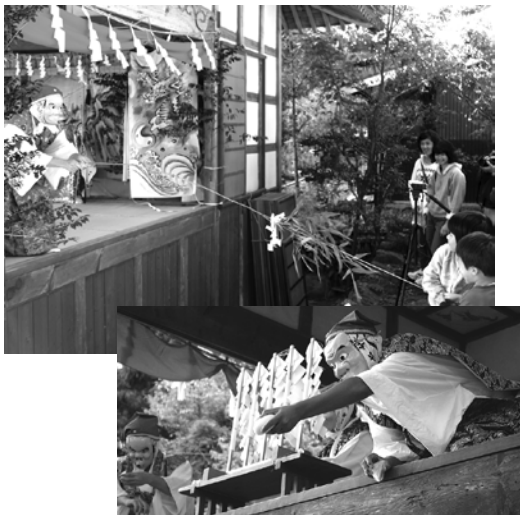
◆坂本地区では、八幡大神社に神代里神楽があり、見る人の心をとらえていました。【村指定重要無形文化財】 【11月3日】