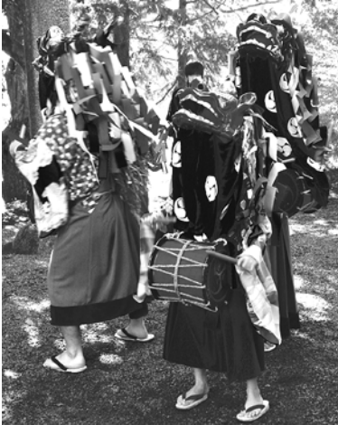
◆皆谷地区では、朝日根八幡神社に獅子舞が奉納されました。子どもたちも参加し、伝統的な舞は次世代へと受け継がれていきます。【村指定無形民俗文化財】 【11月3日】

11月上旬に村内各地で秋まつりやイベントが開催されました。各地では地元の方々をはじめ多くの人でにぎわいました。その様子を写真でお伝えします。