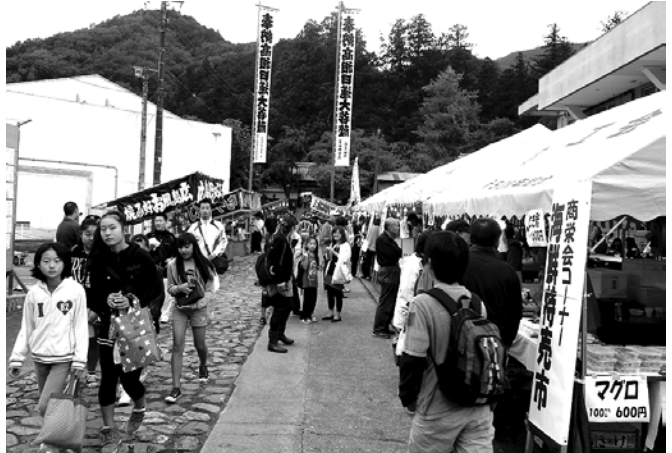
◆コミュニティセンター周辺では、浄蓮寺の「お会式」と合わせ、「第13回ふるさと商工祭」が開催され、今年も多くの人々にぎわっていました。【11月2日】