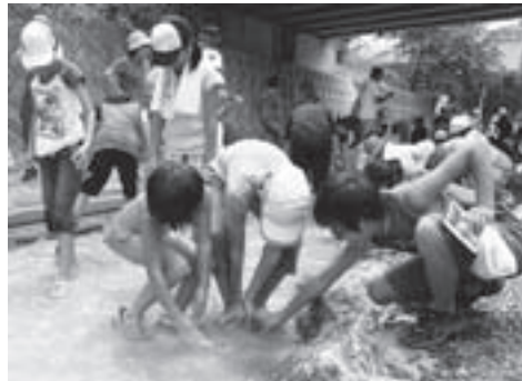
▶ ニジマスのつかみ取り