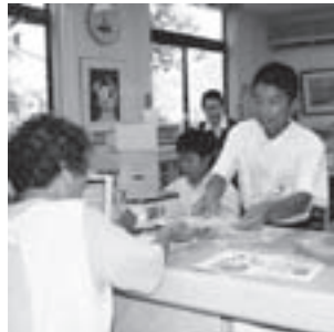
▲ 東秩父郵便局にて