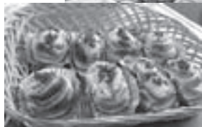
おいしいパンが 焼き上がりました！