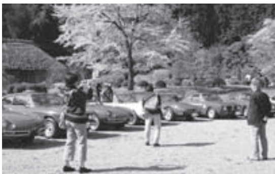
▶アルファ・ロメオ大集合