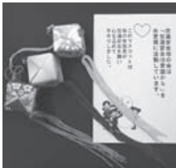
母の会で作成した交通安全マスコット